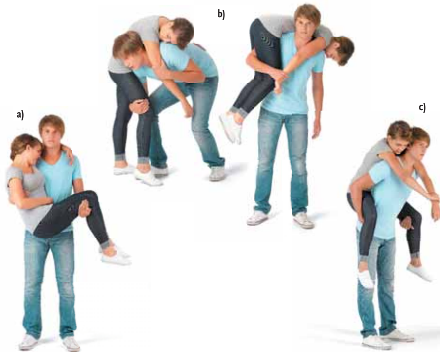
Przenoszenie poszkodowanego: a) sposobem „matczynym”, b) sposobem „strażackim”, c) „na barana”

Jeżeli jest dwóch ratowników, wówczas najlepiej jest przenosić osoby wyczerpane, stosując „krzeselko dwuręczne”. Ratownicy kucają twarzami do siebie (z wyprostowanymi plecami) po obu stronach poszkodowanego. Krzyżują ręce za plecami poszkodowanego i chwytają za pasek (poszkodowany obejmuje swoimi rękoma barki ratowników). Drugą parę rąk wsuwają pod kolana poszkodowanego, chwytają się za nadgarstki, przesuwają splecione ręce na środek ud. Podnoszą się równocześnie, pamiętając o utrzymaniu wyprostowanych pleców.