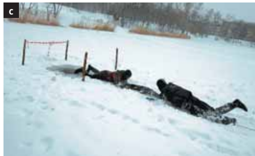
Ewakuacja poszkodowanych: a) w wypadku samochodowym, b) z pożaru, c) w wypadku załamania się lodu