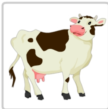
krowa - muu