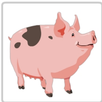
świnia - chrum