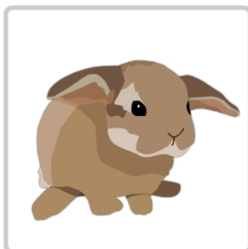
królik - pipi