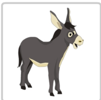
osioł - yyy