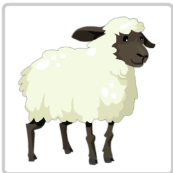
owca - bee

Wycięte karty, rozdajemy pomiędzy graczy obrazkami do dołu. Na środku odkrywamy jedną kartę. Na znak wszyscy gracze odsłaniają pierwszą z kart na swoim stosie. Kto pierwszy odnajdzie i nazwie wspólny symbol dla swojej karty i karty na środku stołu, kładzie swoją kartę na środek. Celem jest jak najszybsze pozbycie się wszystkich kart ze swojego stosu.