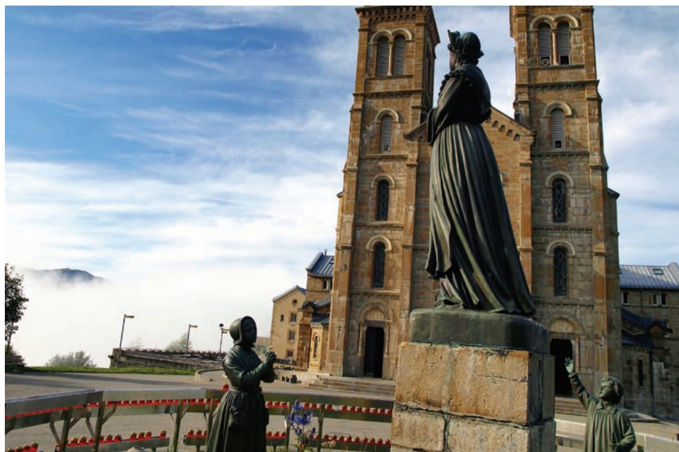
Figura przedstawiająca objawienie się Matki Bożej dzieciom i Sanktuarium w La Salette (Francja)

Przeczytaj, co powiedziała do dzieci podczas objawienia w La Salette. Ma to wartość uniwersalną i jest skierowane również do nas.