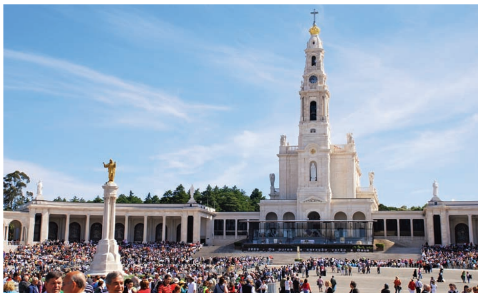
Sanktuarium maryjne w Fatimie (Portugalia)