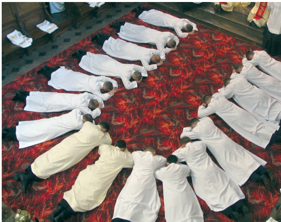
Diakoni leżący krzyżem podczas liturgii święceń kapłańskich