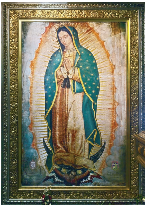
„Jestem Maryją, Niepokalaną Dziewicą, Matką prawdziwego Boga, który daje życie i je zachowuje”. Obraz przedstawia Matkę Bożą z Guadalupe

Mówimy również o objawieniach maryjnych, które skierowane są bezpośrednio do poszczególnych osób (stąd nazywamy je objawieniami prywatnymi) z zadaniem ich rozpowszechniania. Treść tych objawień niczego nie dodaje do objawienia Bożego, ale przypomina niektóre szczególnie ważne w danym czasie prawdy i wezwania. Zgodność z Bożym objawieniem stanowi kryterium uznania ich przez Kościół za autentyczne. Na pewno znane ci są nazwy takich miejscowości, jak Fatima, Lourdes [czyt. lurd], La Salette [czyt. la salet]. Takich miejsc jest o wiele więcej. Czy zastanawiałeś się kiedyś, dlaczego Maryja widzialnie spotyka się z ludźmi?